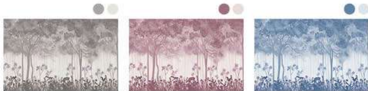
DWA A34 -01